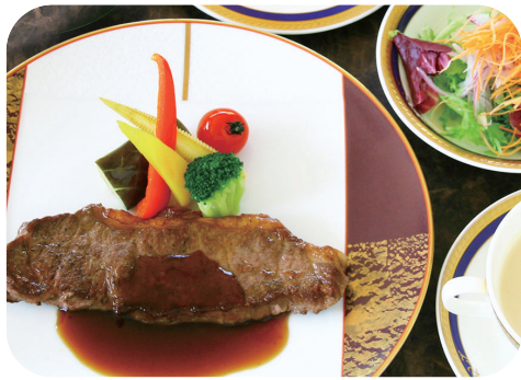
黒毛和牛熟成肉の サーロインステーキランチ サラダ スープ ライスorパン 付 ¥4,300