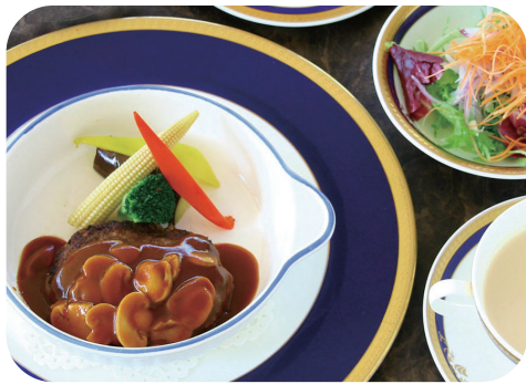
阿蘇高原赤牛の ハンバーグステーキランチ サラダ スープ ライスorパン 付 ¥1,750