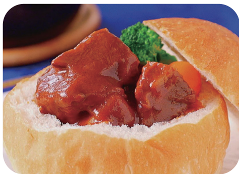
KKRホテルの ビーフシチューポット (BSP) ¥1,200