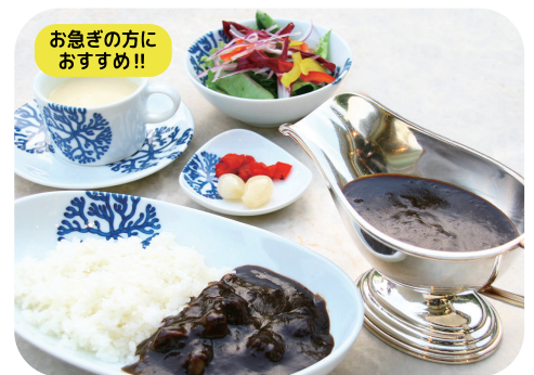
KKRホテルオリジナル ブラックビーフカレーセット サラダ スープ 漬物 付 ¥1,200