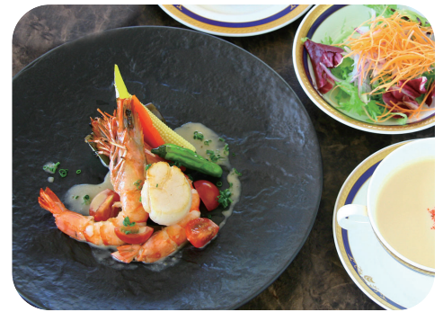
有頭海老と北海道帆立の ポワレランチ サラダ スープ ライスorパン 付 ¥1,700