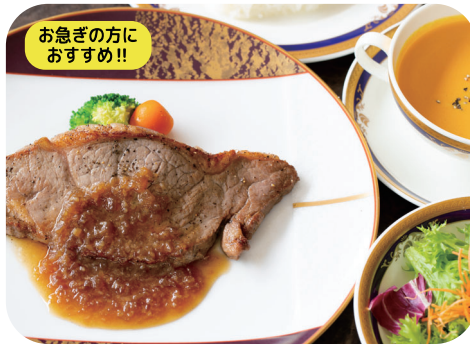
牛サーロインステーキランチ (和風オニオンソース) サラダ スープ ライスorパン 付 ¥1,850