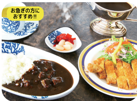
県産ブランド「肥後あそび豚」の ブラックカツカレーセット サラダ スープ 漬物 付 ¥1,750