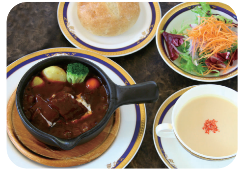
8時間煮込んだ国産牛ホホ肉の ビーフシチューランチ サラダ スープ ライスorパン 付 ¥1,750