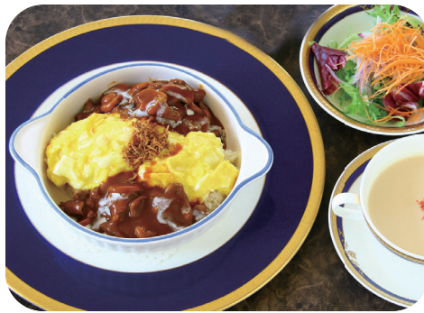
牛フィレ肉のストロガノフ風 オムライスランチ サラダ スープ 付 ¥1,750